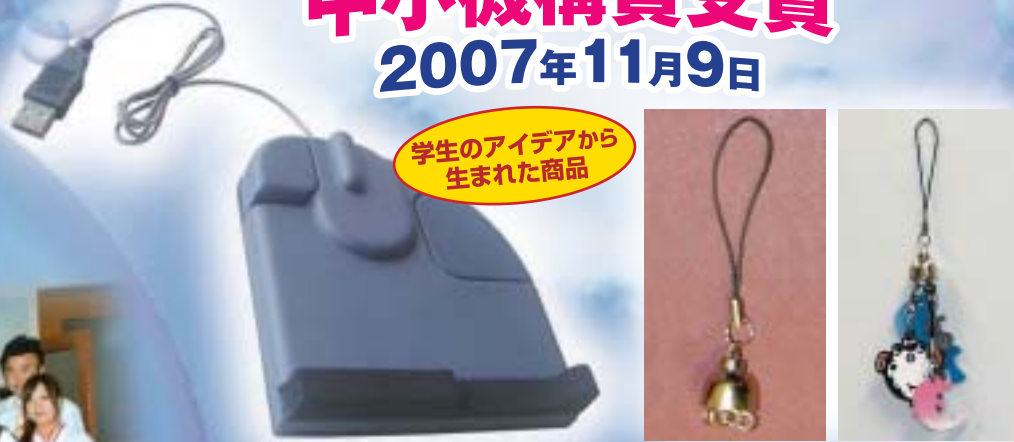
学生のアイデアから生まれた商品